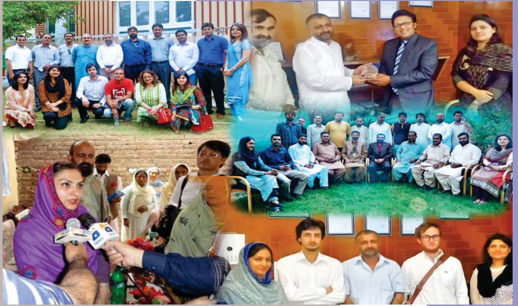
A Selfie members of youth parliament Pakistan along with Marvi Memon State minister / Chairperson BISP