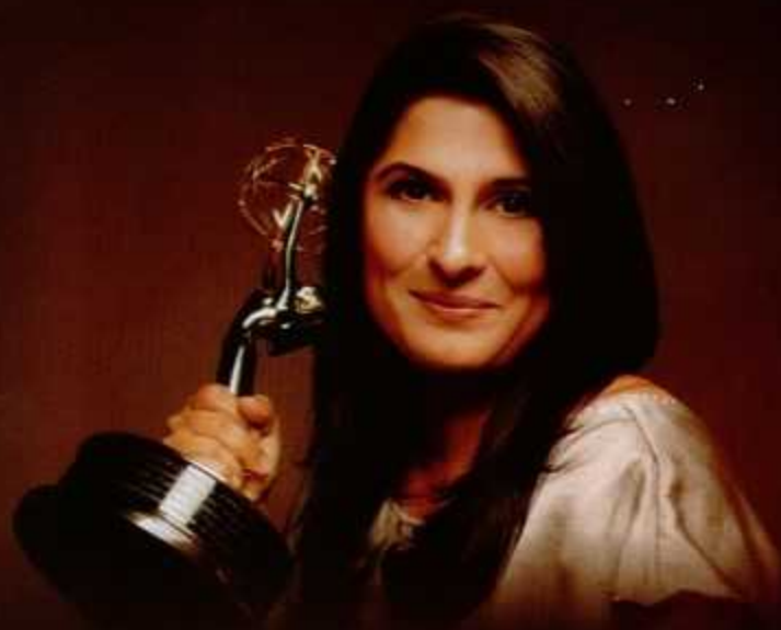
SHARMEEN Obaid Chinoy has been able to make Pakistan proud again by bringing the second Oscar for her documentary on women's issues in the country