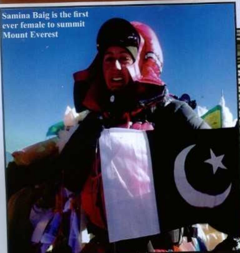
Samina Baig is the first ever female to summit Mount Everest