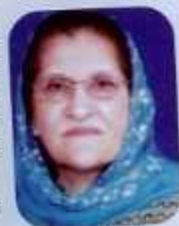
Dr. Meher Taj Roghani Deputy Speaker Khyber Pakhtoonkhwa Assembly

Since last five decades I have not only been raising voice for my rights but also for all other women in our society. But still, women's security and their political, social and economic status in Pakistan are undermined by hardened social biases, discriminatory legislation and unresponsive state institutions; their lives and livelihoods are also threatened by violent extremism especially in KP's context. My all efforts were and are solely directed for empowering and enabling women to lead their life respectfully and in peace. Keeping in account KP's situation, women in other parts of the country did get some attention and even some visible positive changes are also seen. Yet, the situation in KP is not very conducive towards giving women the freedom and opportunities to flourish. I have been working for women rights and empowerment for many years and now I have been appointed as first deputy speaker in Khyber Pakhtoonkhwa Assembly. It reflects, despite the fact that Khyber Pakhtoonkhwa is undergoing a complex situation; the women are able to create a change. The government's resolve is to prioritize education for all. "I look forward to witnessing a bigger increase in local women's leadership and their participation and empowerment in all fields of life."