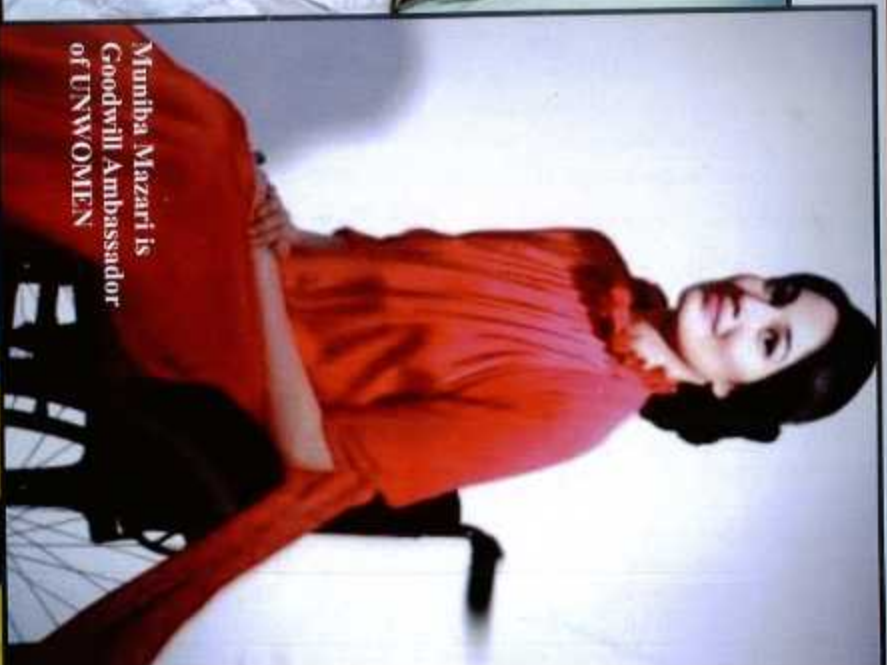
Muniba Mazari is Goodwill Ambassador of UNWOMEN