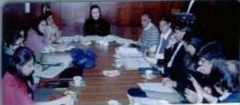
سویڈن برقی خواتین میں 15 نومبر 2016ء کو خواتین کے عالمی دن کے حوالے سے ایسی جگہ کی صدارت کر رہی ہیں۔

وزیر اعظم نواز شریف 8 مارچ 2016 بروز منگل کو خواتین کی ترقی کے حوالے سے نئی پالیسی پیش کریں گے۔ اس بات کا اعلان وزیر اعظم کے خصوصی مشیر برائے انسانی حقوق پروفیسر ظفر اللہ نے اسلام آباد میں ایک انٹرویو میں کیا۔ انہوں نے کہا کہ اس پالیسی کا اعلان خواتین کے عالمی دن کے موقع پر کیا جائے گا۔ ان کا یہ بھی کہنا تھا کہ یہ نئی پالیسی خواتین کے سماجی حقوق کا تحفظ کرے گی اور ان کو سماجی استحکام فراہم کرے گی۔ اس کے علاوہ یہ پالیسی خواتین کو ان کے کام کرنے کی جگہ پر زیادہ سے زیادہ سہولیات فراہم کرے گی۔