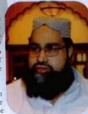
Hafiz Tahir Mahmood Ashrafi Chairman Pakistan Ulama Council Member, Council of Islamic Ideology

The sacrifice of men, women and children in the Pakistan Movement was given to establish an independent, peaceful and sovereign state for the Muslims. It was envisaged that every man and woman would enjoy equal rights without any discrimination on the basis of color, creed or caste, and have access to education, health, jobs and development.